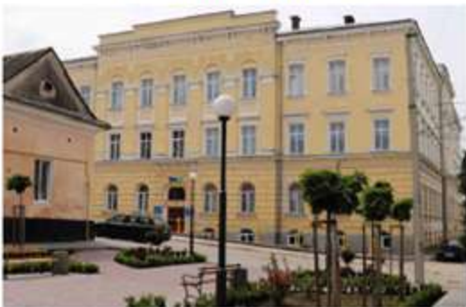
Бережани – 2024

ЗБІРНИК наукових праць за матеріалами IV Всеукраїнської студентської науково-практичної конференції «ПРОБЛЕМИ ТА ПЕРСПЕКТИВИ РОЗВИТКУ ОСВІТИ, НАУКИ ТА ТЕХНОЛОГІЙ В УМОВАХ ВОЄННОГО СТАНУ»