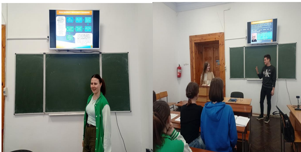
заняття-тренінг (творча взаємодія між учасниками) «Фінансова грамотність: заощадження інвестицій»

14 березня відбулося планове засідання студентського наукового гуртка у вигляді заняття-тренінгу (творча взаємодія між учасниками) за темою дослідження «Фінансова грамотність: заощадження інвестицій» із підготовкою тематичної презентації із циклу «Сімейна бухгалтерія».